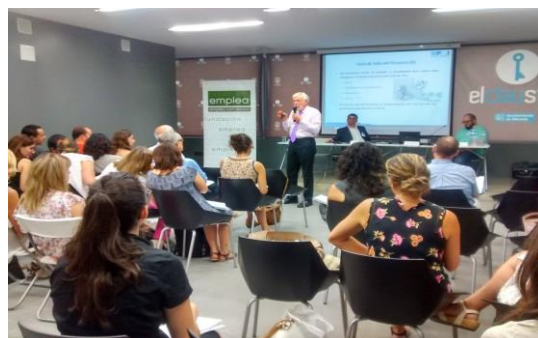
Curso de Verano 2015