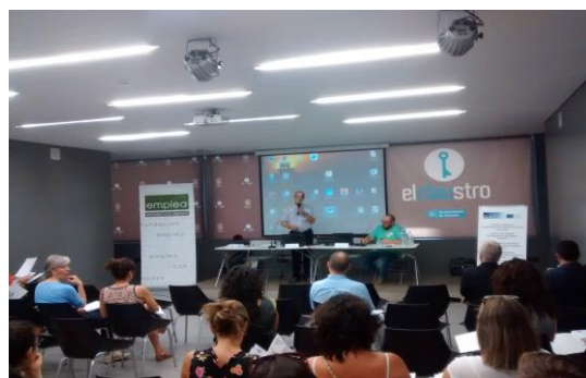
Curso de Verano 2015