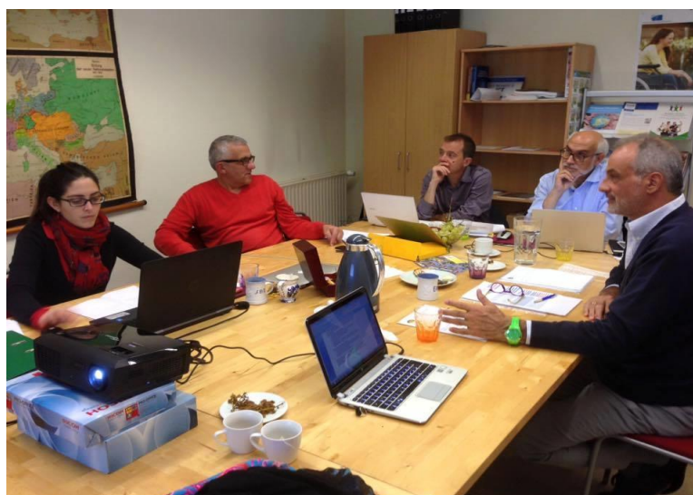
Reunión en Bruselas. Proyecto Desc