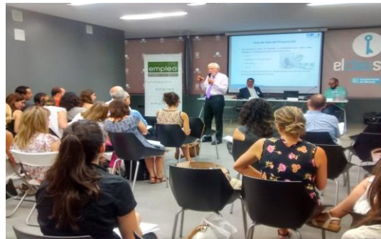
Curso de Verano 2015