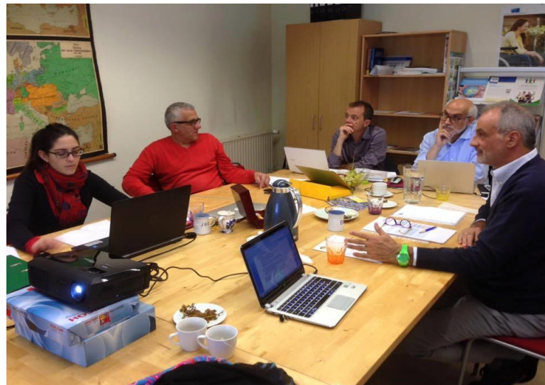
Reunión en Bruselas. Proyecto Desc