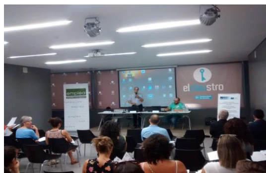
Curso de Verano 2015