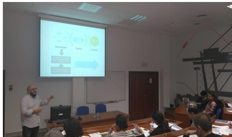
Jornada Autoempleo Valencia Port

La red proporcionará datos sobre el impacto social y el retorno de cada uno de los proyectos e iniciativas, buscado evidenciar el valor social de las entidades.